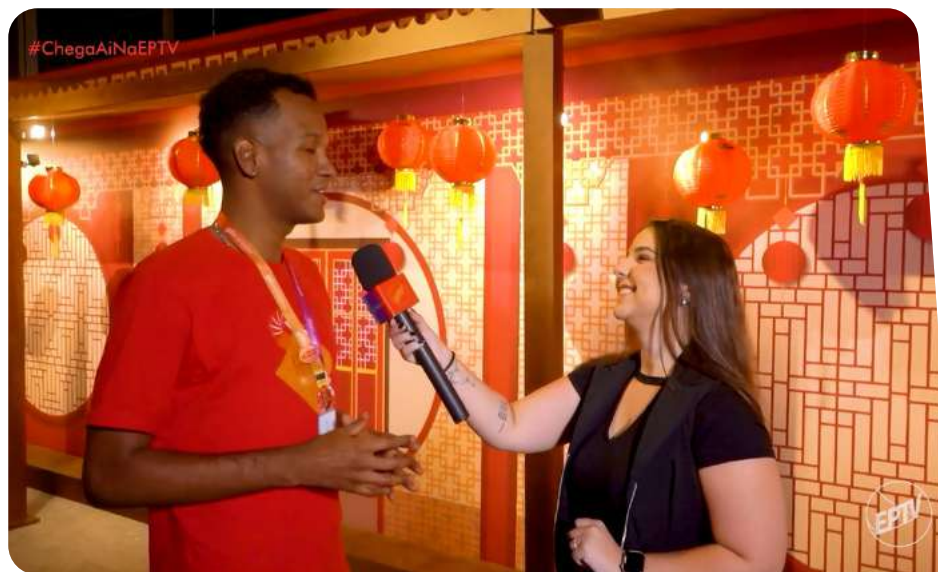
foto: Gravação da exposição “China Milenar: Lendas, Mitos e Festivais” para o programa Chega Aí da EPTV local: Campinas (SP)

foto: Visita do Prefeito Municipal de Campinas ao Atendimento Móvel CPFL durante a programação do Festival da Lua. local: Campinas (SP)