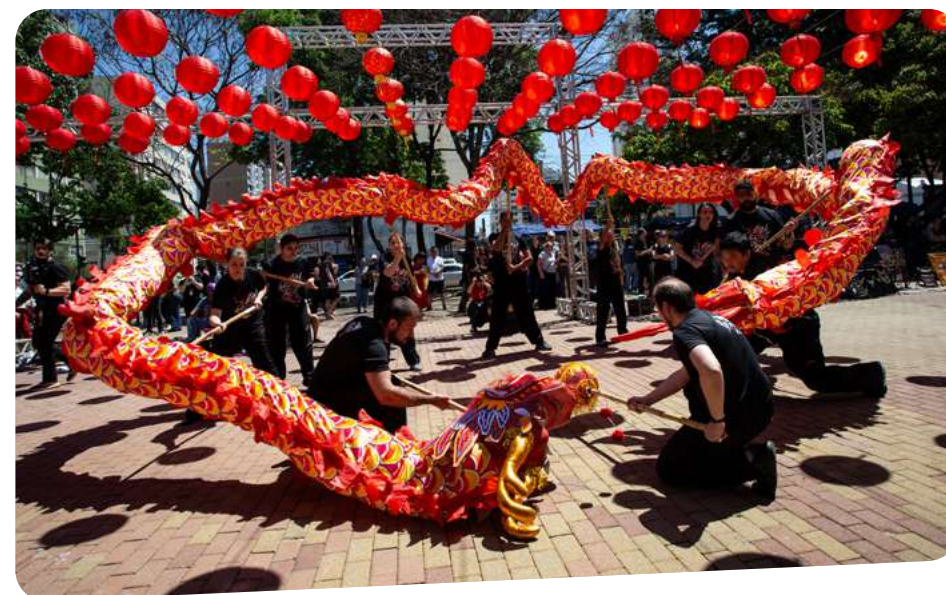
foto: Festival da Lua local: Centro de Convivência Cultural, Campinas (SP)

O Festival da Lua também marcou a nona edição da frente CPFL Intercâmbio Brasil-China. Realizado no Centro de Convivência, em Campinas (SP), o evento celebrou a cultura chinesa com ativações tecnológicas, apresentações e oficinas de máscaras, corte em papel e nós, entre outros.