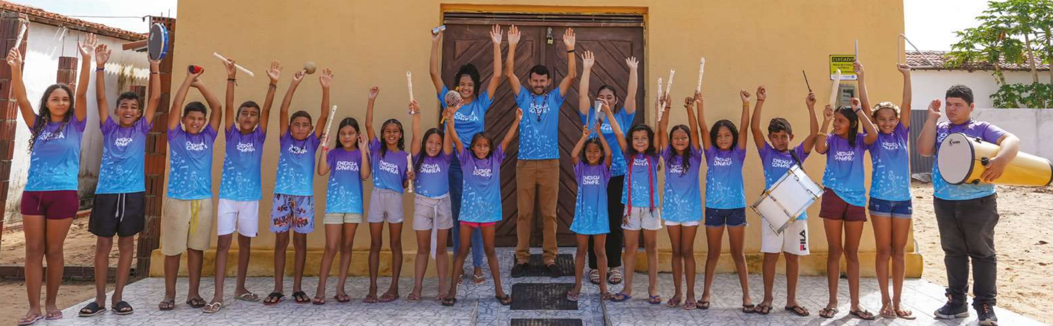
local: Comunidade Indígena de Santa Terezinha (RN)