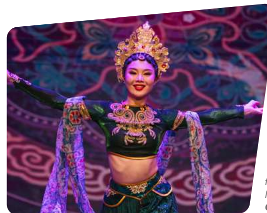
foto: Espectáculo Cores da China local: Teatro Castro Mendes, Campinas (SP)

pessoas em 10 espetáculos de dança e música