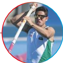
Thiago Braz, medalhista olímpico e ex-aluno da Orcampi

Passa a ter cinco frentes de atuação, visando transformar as realidades das comunidades de maneira sustentável