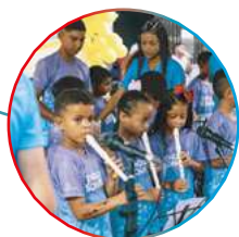
alunos do projeto Energia Sonora, em João Câmara (RN)

Começam as transmissões ao vivo de sua programação pela internet, ampliando a presença nas redes sociais