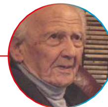
Zygmunt Bauman, no Café Filosófico CPFL em 2017

Transforma-se em Instituto CPFL , passando a promover e apoiar projetos de música e esporte com impacto social