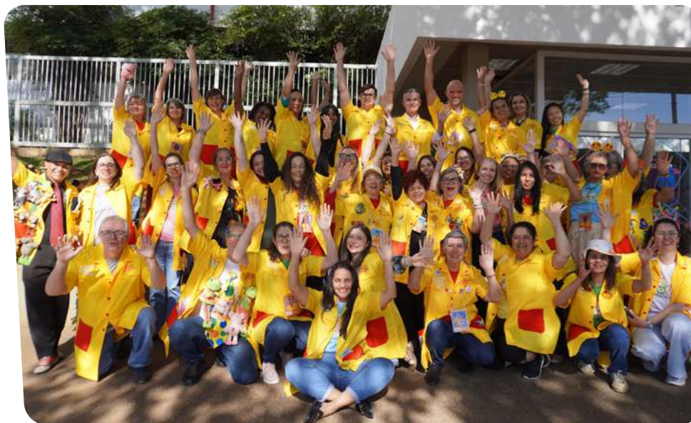
local: Campinas (SP)

A Casa Ronald McDonald , em Campinas (SP), que recebe famílias de pacientes oncológicos atendidos no Hospital Boldrini, é uma das organizações que passaram a contar com o apoio do Instituto CPFL