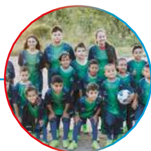
alunos do projeto Fábrica de Atletas, em João Câmara (RN)

Completa 20 anos, olhando para o futuro e reforçando o compromisso de impactar positivamente a sociedade