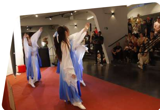
foto: Festival da Lua local: Centro de Convivência Cultural, Campinas (SP)