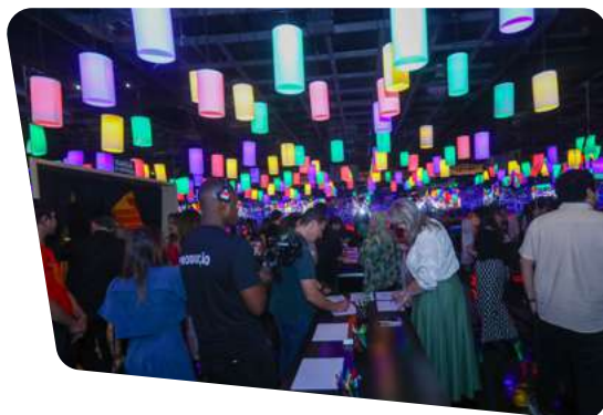
foto: Exposição "China Milenar: Lendas, Mitos e Festivais" local: Campinas (SP)

pessoas na exposição China Milenar: Lendas, mitos e festivais