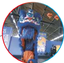
Festival da Lua, evento da frente CPFL Intercâmbio Brasil China

Passa a se chamar CPFL Cultura , expandindo sua atuação para outras cidades da área de concessão da CPFL