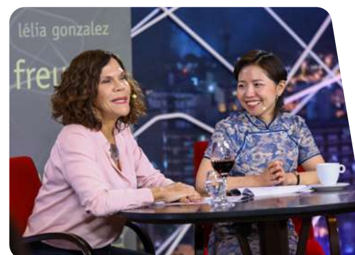
foto: Café Filosófico CPFL Campinas "A ascensão da China e o seu impacto sobre o mundo" local: Campinas (SP)

visualizações no Café Filosófico CPFL especial China na TV Cultura